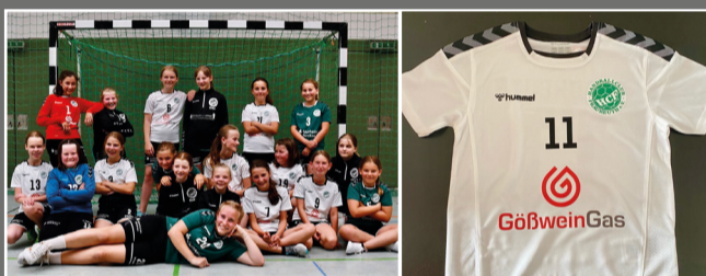
D-Jugend Handball-Club Fraureuth